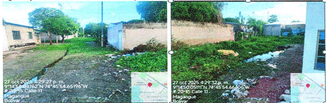
Figura 4 y 5. Evidencia de vertimiento directo al predio que colinda con la vivienda de la quejosa.