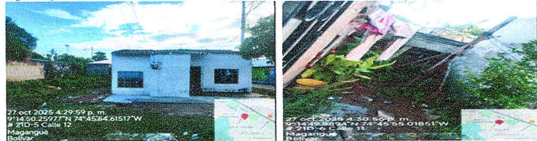
Figura 6. Identificación del predio afectado y colindante.