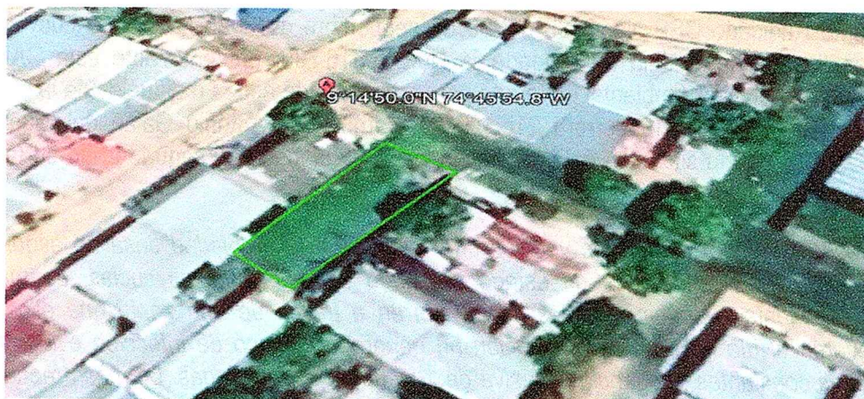
Figura N.º 1. Imagen Google Earth. “Botadero satélite Barrio José Antonio Galán”.